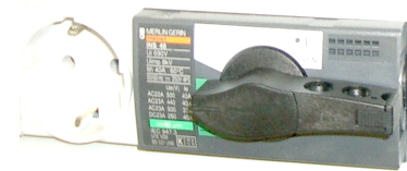
Hoved strøm OFF